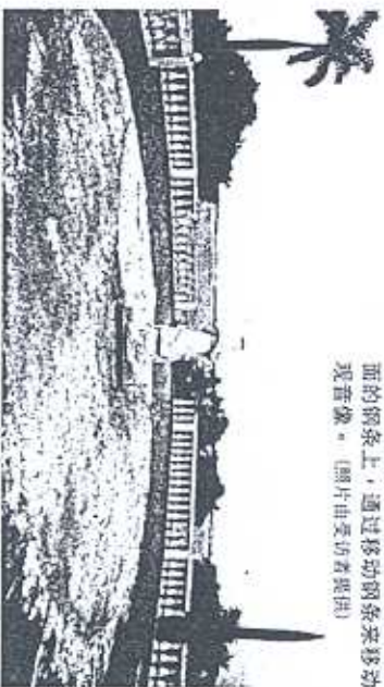
观音像被拆迁时留下凹凸不平的水泥地面,立着一座小得多的观音像。

在移动之前,支撑观音像的平台被架空,观音像由新加坡运来可吊400公吨重的吊车吊起,放置在地面的钢架上,通过移动钢架来移动观音像。